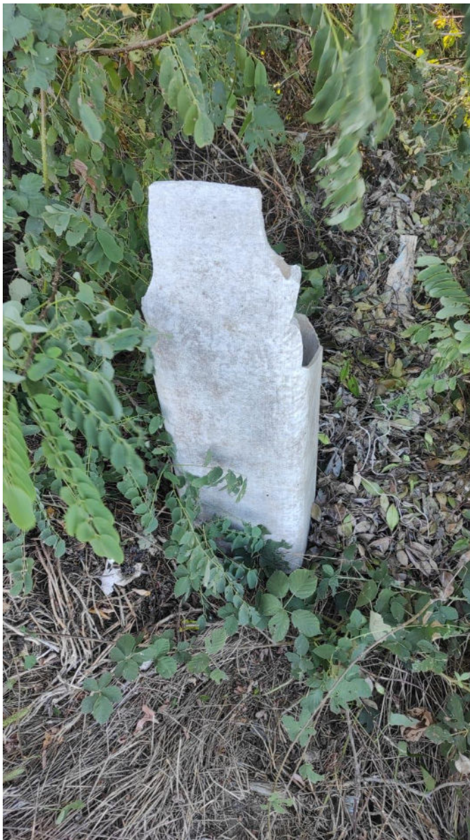
Canna fumaria in materiale eternit (altezza 80 cm. circa) rinvenuto nei pressi del ponte sul Canale Depretis lungo la strada vecchia per Cigliano